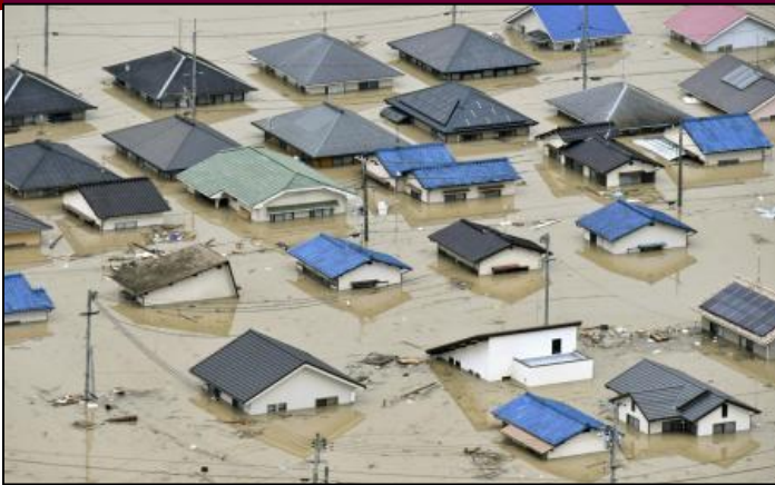
「集中豪雨(洪水)」被害